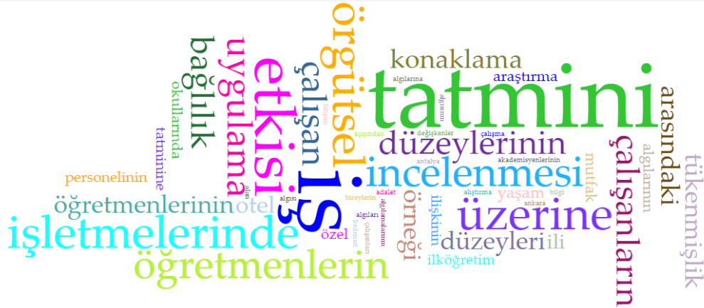
Şekil 2. Tez Çalışmalarının Başlıklarından Oluşturulan Kelime Bulutu

Şekil 1. incelendiğinde araştırma kapsamına alınan 19 adet lisansüstü tez çalışmasının 8'inin eğitim ve öğretim konu başlığında düzenlendiği, 6'sının turizm, 2'sinin işletme ve spor ve 1'inin beslenme ve diyetetik alanında gerçekleştirildiği görülebilmektedir. Ayrıca Tablo 10.'da sunulan verilere göre inceleme kapsamındaki tezlerin yalnızca 1'i doktora çalışması iken 18'inin yüksek lisans tezi olduğu görülebilmektedir. Şekil 2.'de araştırma kapsamına alınan tez çalışmalarının başlıkları değerlendirildiğine oluşturulan kelime bulutu görülmektedir.